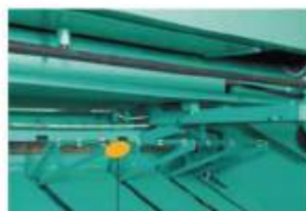
Visoko prihvatni sistem lima