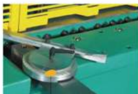
Štetujući ugaoni graničnik